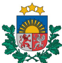
Lauksaimniecības datu centrs

Lauksaimniecības datu centrs (LDC) ir Latvijas Republikas Zemkopības ministrijas pakļautībā esoša tiešās pārvaldes iestāde, kuras uzdevums ir nodrošināt valstī vienotu informācijas datubāzi par dzīvniekiem un lopkopības nozari. Tajā skaitā, LDC veic tādu datu vākšanu, analīzi, apstrādi, un uzturēšanu, kā ganāmpulku, novietņu un dzīvnieku datubāze, piena pārraudzības rezultāti, ciltsdarba informācija, kā arī cita informācija.